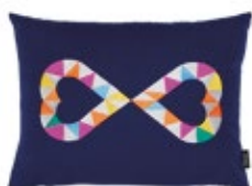
Embroidered Pillows Double Heart 2, azul Al 300 x A 400