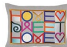
Embroidered Pillows Home Sweet Home, gris claro Al 300 x A 400