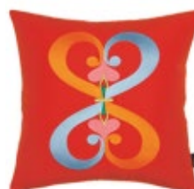
Embroidered Pillows Double Heart, rojo Al 400 x A 400