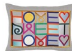
Embroidered Pillows Home Sweet Home, grigio chiaro A 300 x L 400