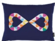
Embroidered Pillows Double Heart 2, blu A 300 x L 400