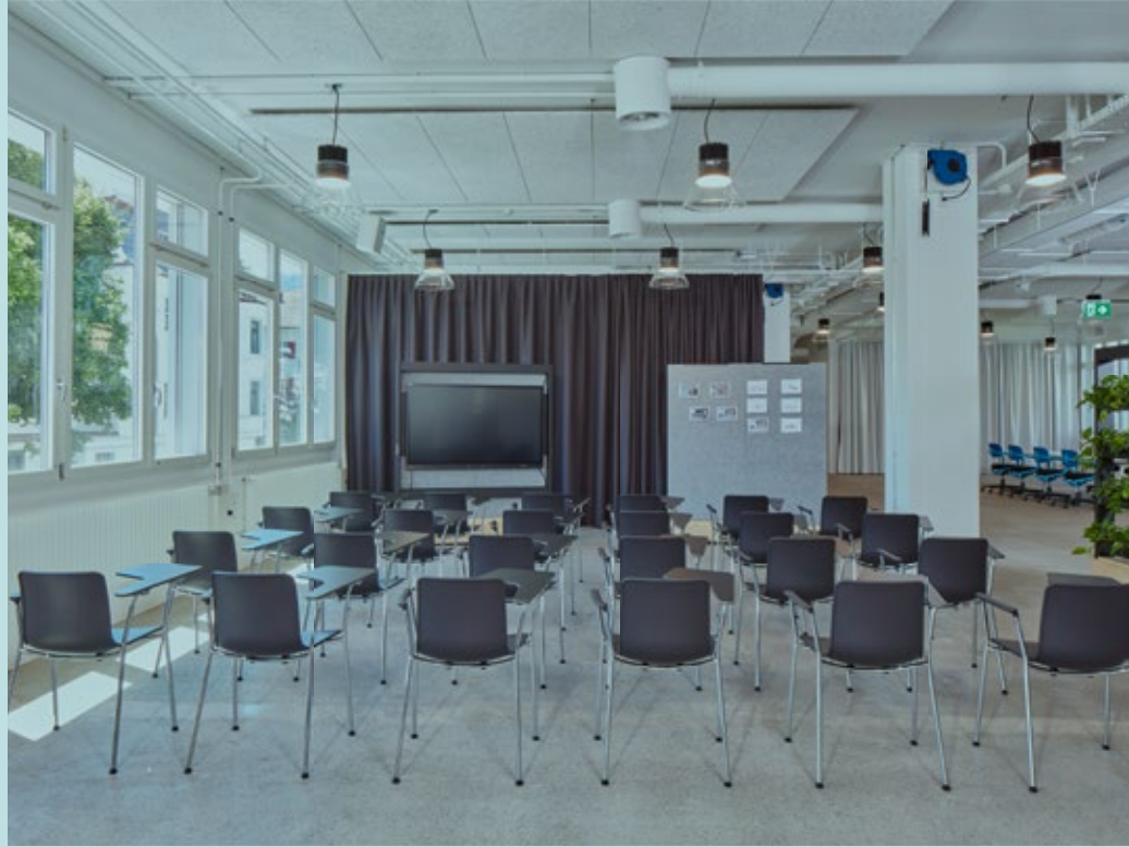
Tipologías de salas 4: Town Hall