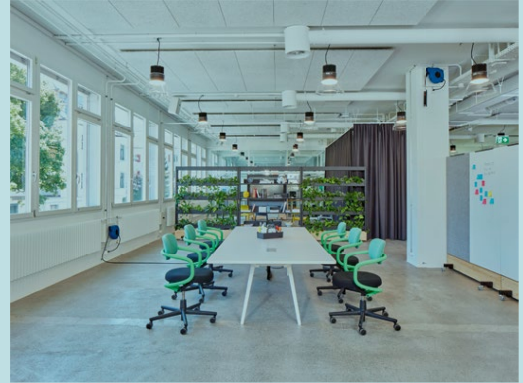
Tipologías de salas 3: Project Space

creativos, para quienes el equilibrio entre el trabajo, la vida personal y el estilo de vida digital es una reivindicación no negociable.