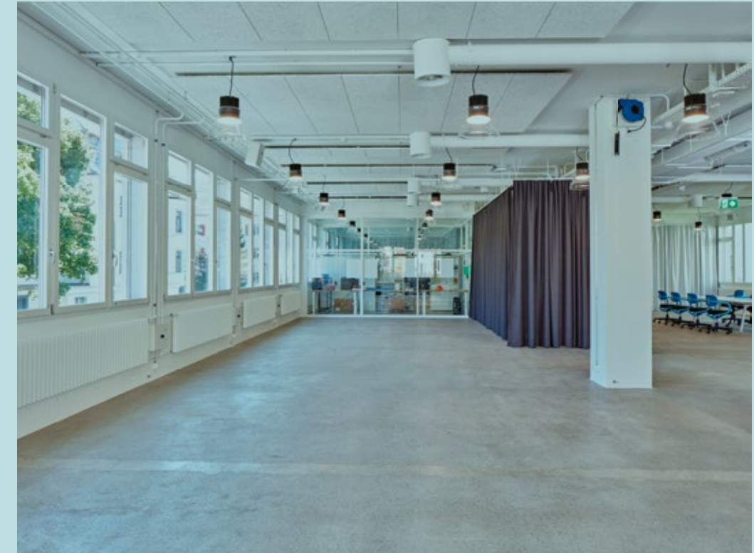
Tipologías de salas 1: Empty Space