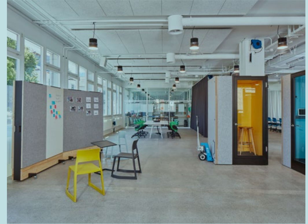
Tipologías de salas 5: Open Workspace

instalando, para las llamadas telefónicas que necesitan privacidad, varias cabinas que pueden moverse fácilmente con carretillas elevadoras. El arquitecto decidió no crear ningún espacio cerrado más, optando en su lugar por un sistema de paredes móviles que permite utilizar las zonas de la oficina de diferentes maneras.