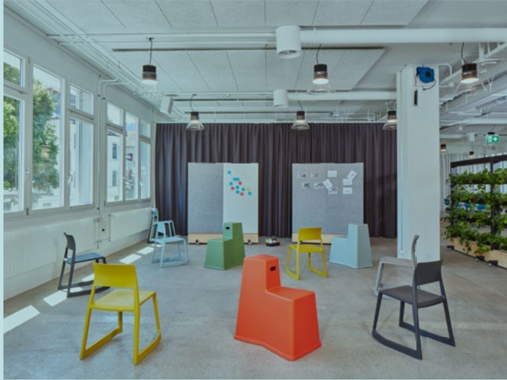
Tipologías de salas 2: Workshop Space