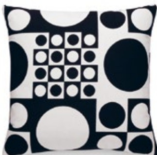
Classic Pillows Maharam Geometri black/white A 400 x L 400