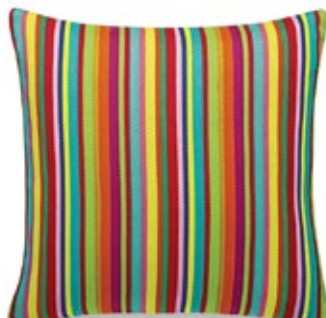
Classic Pillows Maharam Millerstripe multicolored bright H 400 x B 400