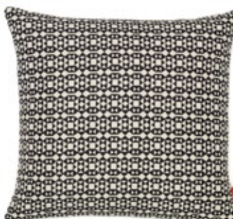
Classic Pillows Maharam Facets, black/white H 300 x B 400