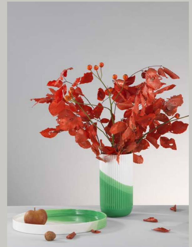
Boven links: zomer en herfst met een kleurspel in groentinten Boven rechts: herfst met beukenbladeren en rozenbottels Onder: lente met berkentakken, tulpen, anemonen, ranonkels en klapprozen