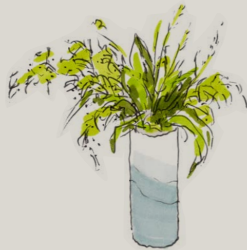
Bladeren, grassen en takken die los geschikt zijn voor een spel van groentinten en structuren.