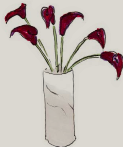
Bloemen als calla's, strelitzi's of hortensia's als solitair of in kleine groepjes zien er eenvoudig en elegant uit.