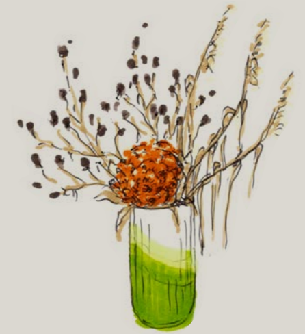
In de herfst afgesneden takken van fruitbomen en grassen voor een lang houdbaar arrangement met droogbloemen.