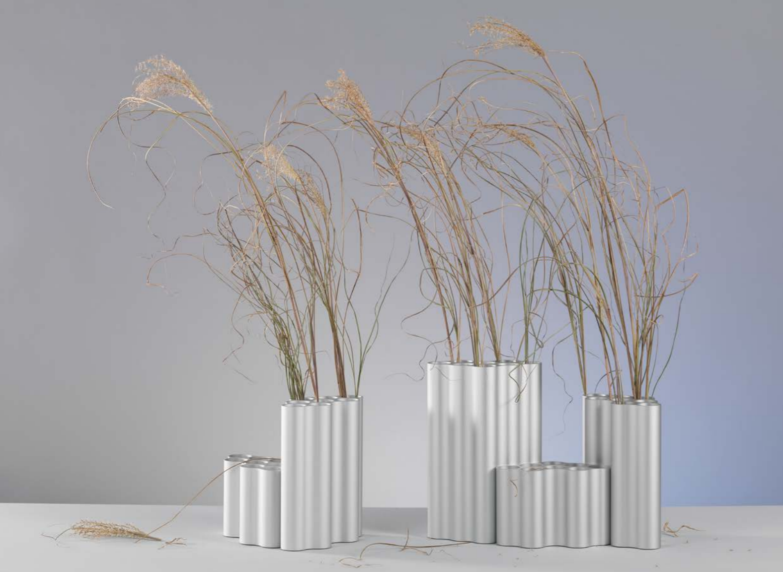
Boven: herfst en winter met grassen Onderaan links: het hele jaar door zomer met gloriosa Onderaan rechts: lente met kersenbloesemtakken en tulpen