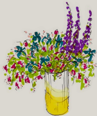
Losjes geschikt boeket van weide- of tuinbloemen