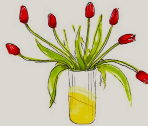
Een variëteit aan bloemen, nu eens overhangend, dan weer recht, afhankelijk van de groei van de plant.