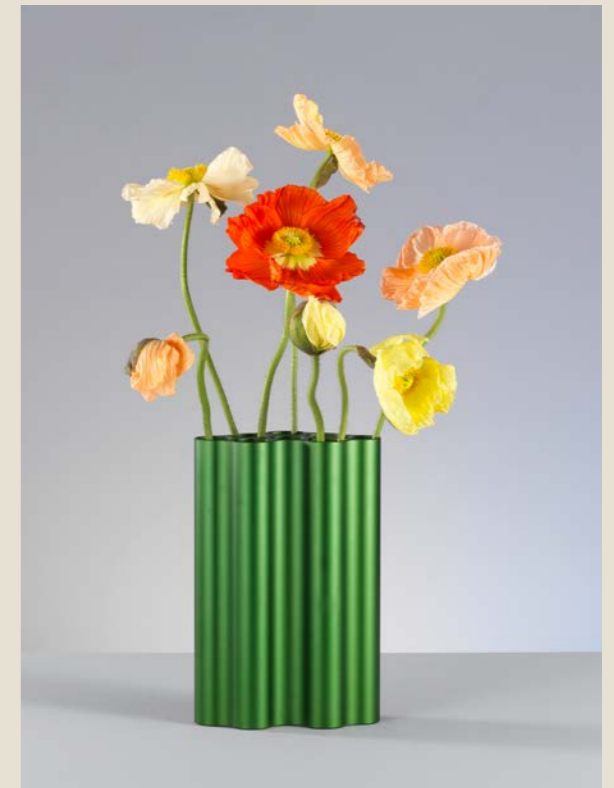
Boven links: lente met calla. Anemonen, eucalyptus en grassen Boven rechts: lente met klaprozen Onder: lente- of zomerweide in Nuages