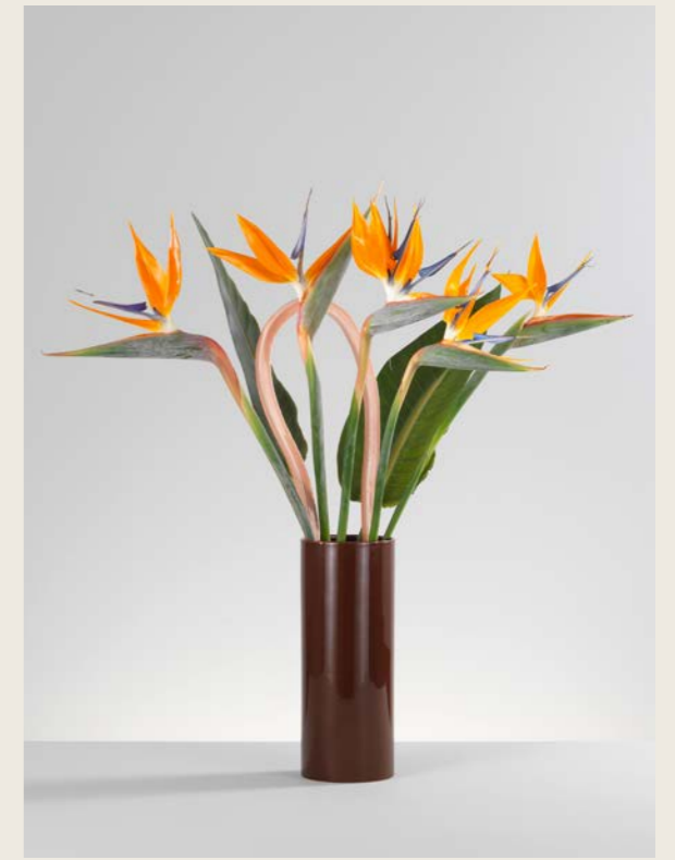
Bovenaan links: sculpturaal object Bovenaan rechts: solitaire strelitziabloem met bladeren Onderaan: zomer met jasmijn- en clematistakken