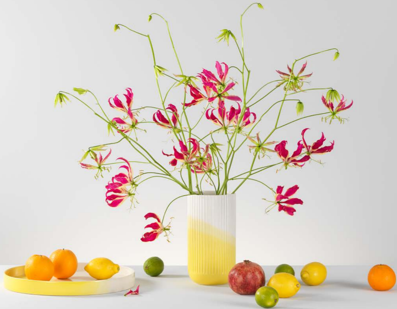
Boven: het hele jaar door zomer met gloriosa Onderaan links: winter met takken en Vitra Girard Ornaments, eucalyptus en bromelia's Onderaan rechts: zomer met iris, clematis en een tak zonder bladeren