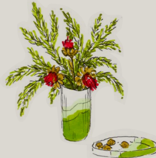
Een mooie tak zorgt voor een contrasterende structuur in de winter en wordt een feestelijk ornament met de Vitra Girard Ornaments.