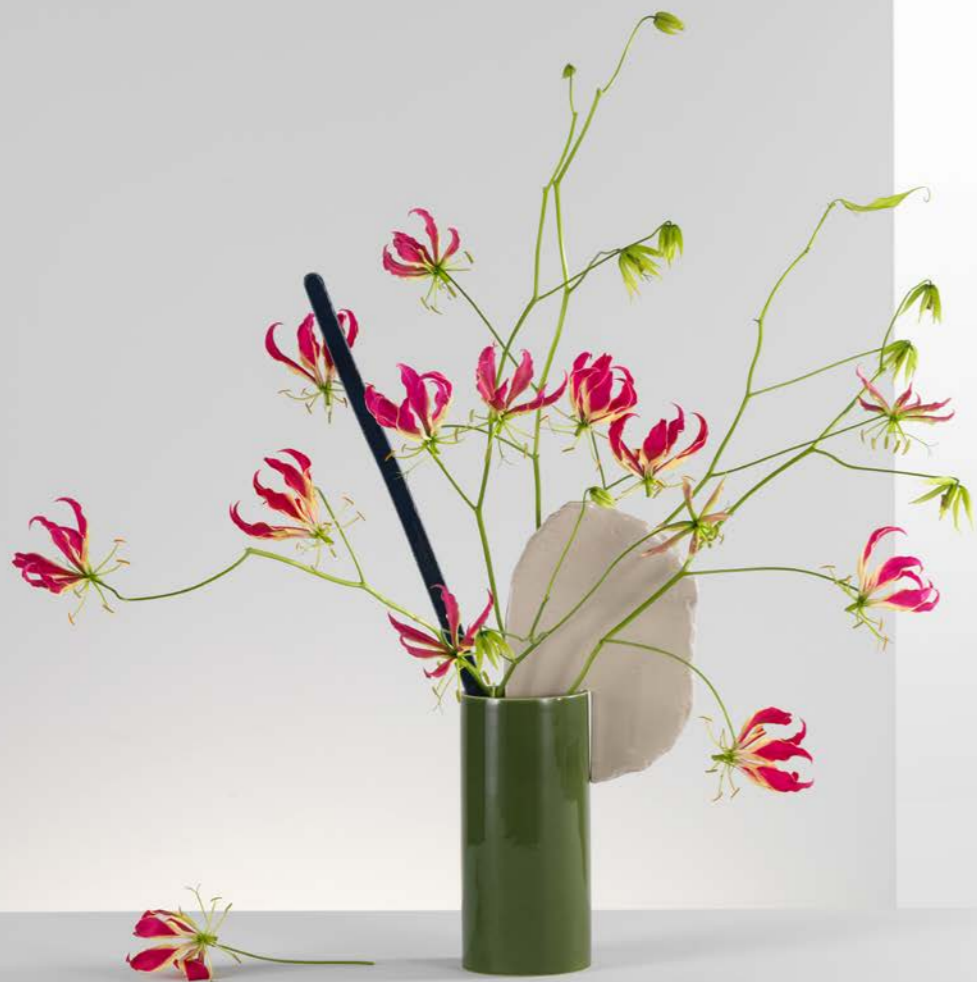
Boven: het hele jaar door zomer met gloriosa Onderaan links: lente met clematis en ranonkels Onderaan rechts: lente en zomer met iris