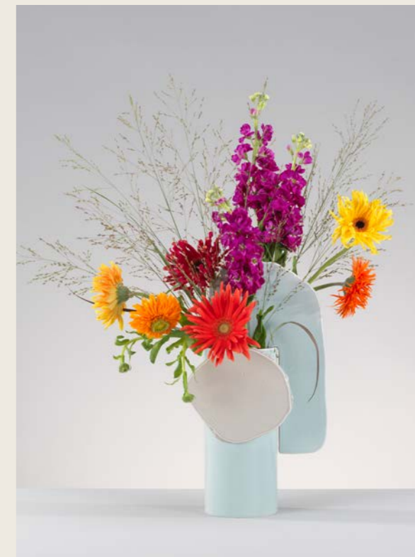
Top left: winter met lelies, lisianthus en amaryllis Bovenaan rechts: lente en zomer met matthiola's, gerbera's, goudsbloemen en grassen Onderaan: winter met takken en Vitra Girard Ornaments