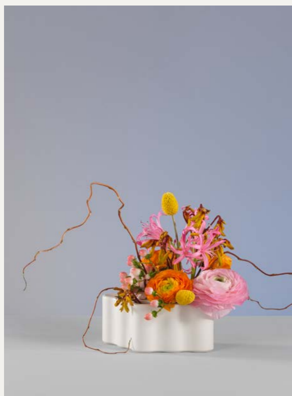
Boven: lente met tulpen en krulhazelaar Onderaan links: lente en zomer met ranonkels, craspedia, hypericum en nerines Onderaan rechts: zomer met iris, trommelstokjes (craspedia) en berkentwijgen