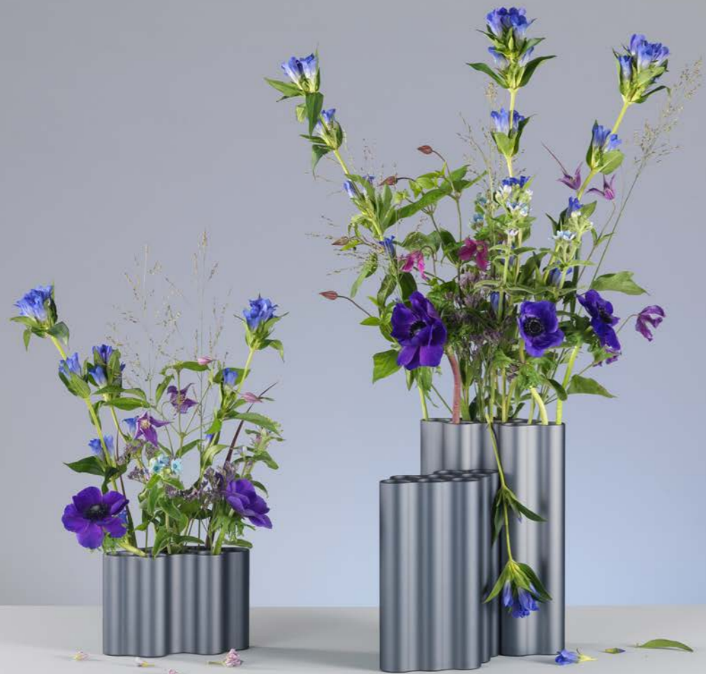
Boven: lente en zomer met gentiaan, clematis en anemonen Onderaan links: calla, ranonkels, eucalyptus, takken en grassen Onderaan rechts: lente-zomerherfstspel met groentinten en structuren