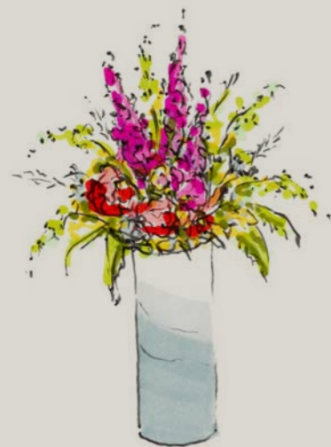
Vertel uw bloemist hoe hoog uw vaas is en hij of zij zal een passend boeket voor u samenstellen.