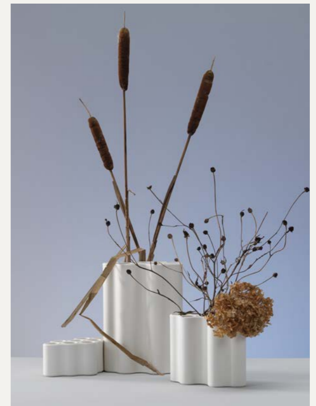
Boven links: lente met narcissen en dwergkwee Boven rechts: herfst en winter met kattestaarten, zonnebloemen en zomerhortensia Onder: winter met kleine sparren met wortels, krukhazelaar met Vitra Girard Ornaments, amaryllis en de Eames House Bird