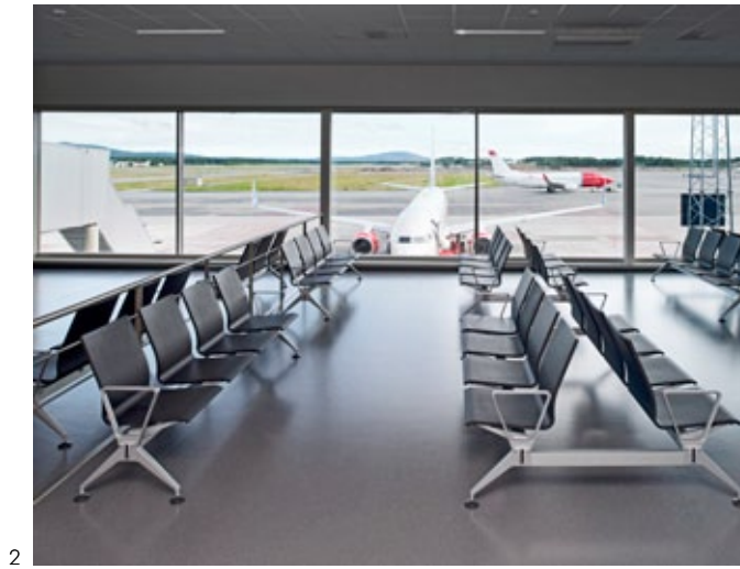
2 Oslo-Gardermoen Airport, Oslo / Meda Gate