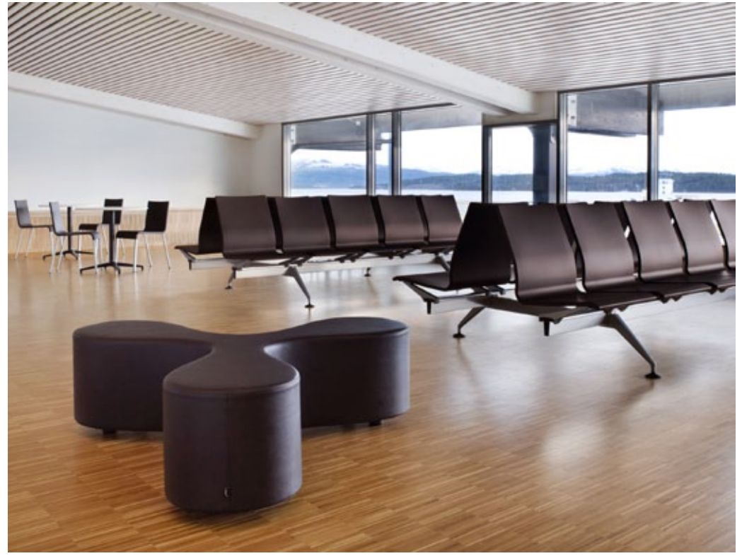
7 Molde Airport, Molde / Flower, Meda Gate, .03, Bistro Table