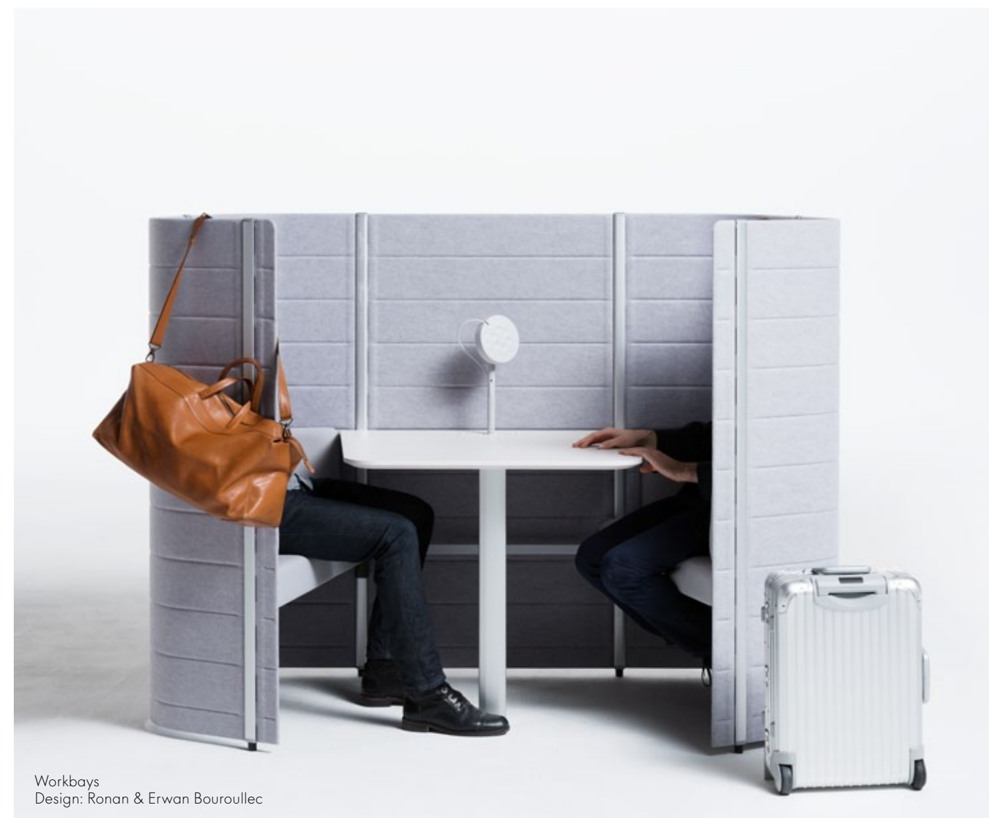
Workbays Design: Ronan & Erwan Bouroullec

Aéroports, gares et autres espaces publics sont des endroits souvent fréquentés par d'innombrables personnes 24 heures sur 24. Leur conception et leur agencement contribuent aussi bien à l'efficacité (par exemple des transports) qu'au bien-être de leurs utilisateurs. Les produits choisis doivent de ce fait répondre aux exigences les plus élevées en termes de qualité, de conception et de convivialité.