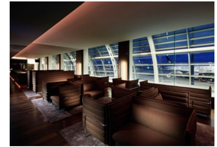
9 Haneda Airport, Tokyo / Alcove