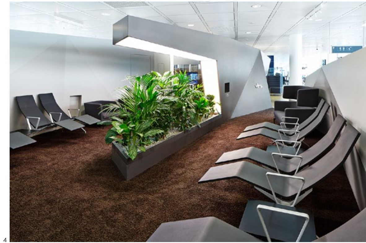
4 Munich Terminal 2 Lounge, Munich / Meda Gate, Suita

Les chaises comme .04 ou ID-Chair sont particulièrement adaptées à une utilisation intensive par de nombreux individus différents, et ce également du point de vue de l'ergonomie et de l'hygiène.