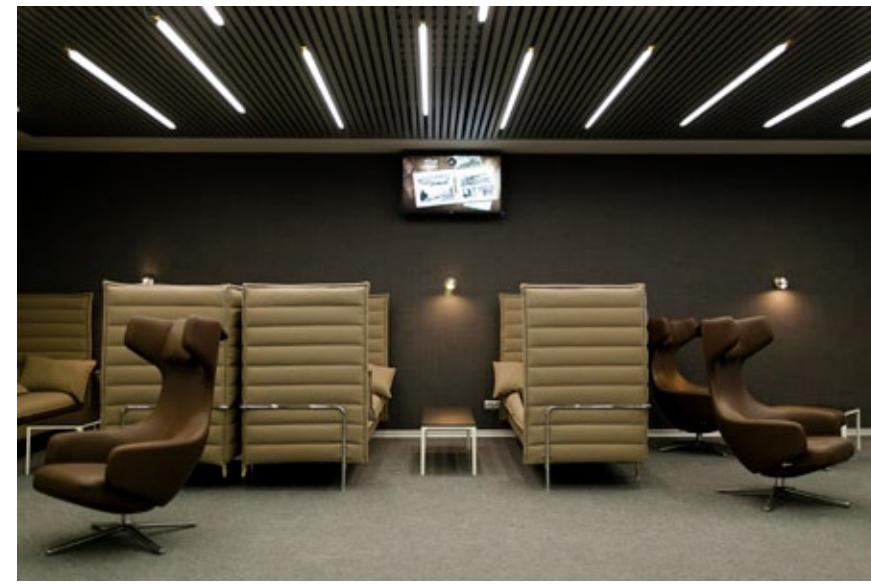
5 Pulkovo Airport Lounge, St. Petersburg / Alcove, Grand Repos, Plate Table

Au travers d'innombrables projets à la surface du globe, Vitra a développé un savoir-faire inépuisable dans la planification et l'agencement d'environnements de bureaux. Leur point commun : ils favorisent tous le bien-être et donc la motivation et l'efficacité des employés.