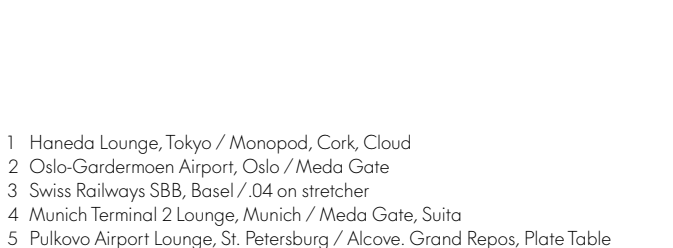
4 Munich Terminal 2 Lounge, Munich / Meda Gate, Suita