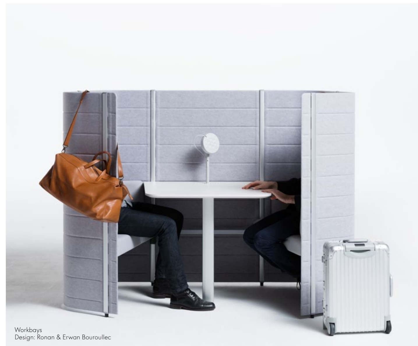
Workbays Design: Ronan & Erwan Bouroullec

Aeropuertos, estaciones y otros espacios públicos suelen ser lugares muy concurridos casi a cualquier hora del día. Su diseño y equipamiento contribuyen tanto al éxito, por ejemplo, del transporte, como al bienestar de quienes los utilizan. Los productos que se emplean deben cumplir los máximos requisitos en cuanto a calidad, diseño y facilidad de uso.