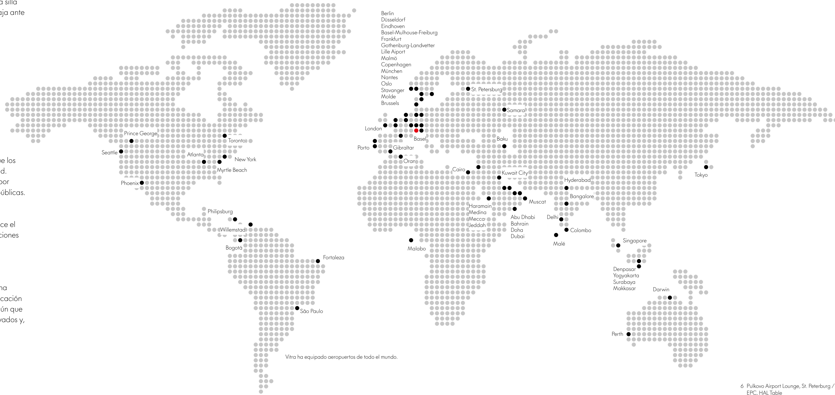
Vitra ha equipado aeropuertos de todo el mundo.