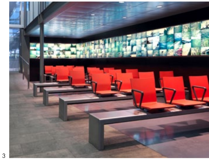
1 Haneda Lounge, Tokyo / Monopod, Cork, Cloud 2 Oslo-Gardermoen Airport, Oslo / Meda Gate 3 Swiss Railways SBB, Basel / .04 on stretcher 4 Munich Terminal 2 Lounge, Munich / Meda Gate, Suita 5 Pulkovo Airport Lounge, St. Petersburg / Alcove, Grand Repos, Plate Table