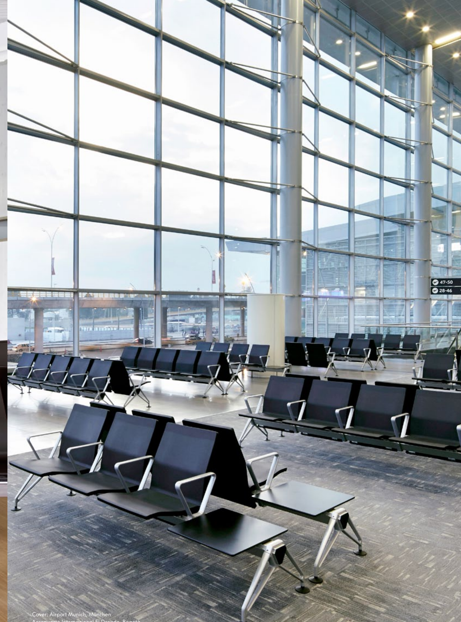
Cover: Airport Munich, München Aeropuerto Internacional El Dorado, Bogotá